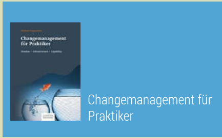
Changemanagement für Praktiker